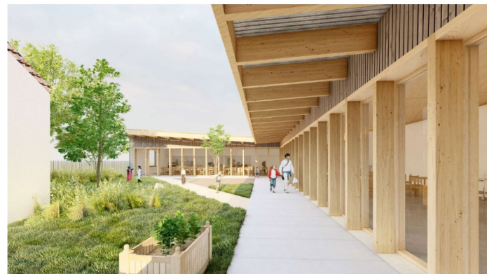
Vue depuis la Rue du manoir - Sartilly