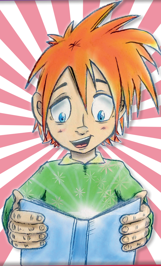
Illustration : Jean-Marc Ozeray